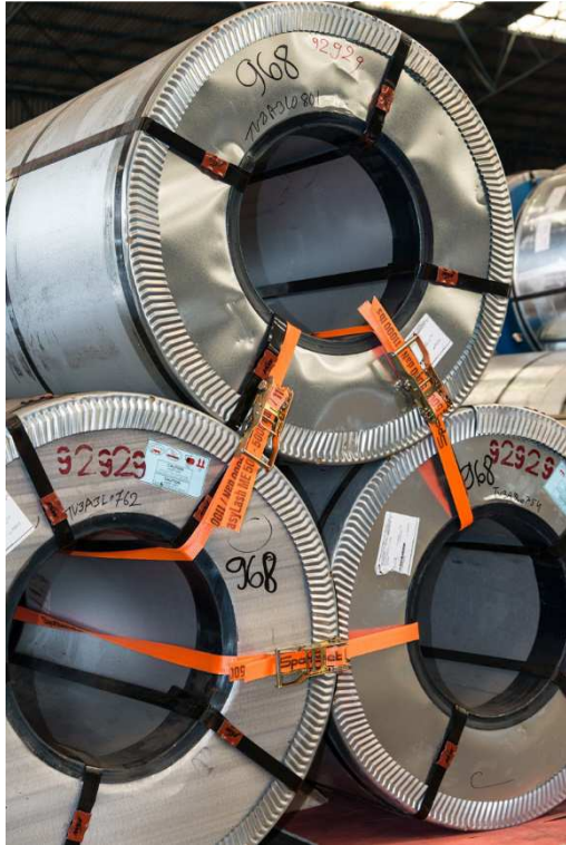
Abb. 1: Das Dynamic Load System ist auch zum Sichern von Coils geeignet.