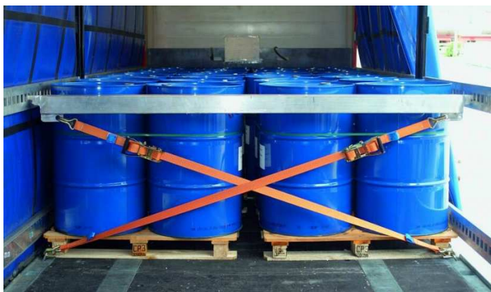
Abb. 2: Fässer, Big Bags u.v.m. können mit TruXafe formschlüssig gesichert werden.

SpanSet GmbH & Co. KG Jülicher Straße 49-51 52531 Übach-Palenberg