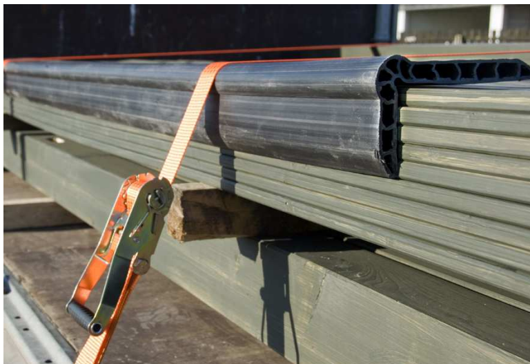
Abb. 6: Der Langkantenwinkel LaWi ist wegen seiner großen Auflagefläche besonders gut zu handhaben.

SpanSet GmbH & Co. KG Jülicher Straße 49-51 52531 Übach-Palenberg