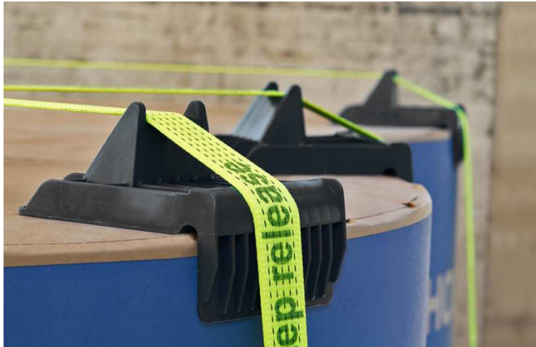
Abb. 5: Der Kantenwinkel KasiPlus schützt empfindliche Papierrollenkanten durch eine Hohlkehle.