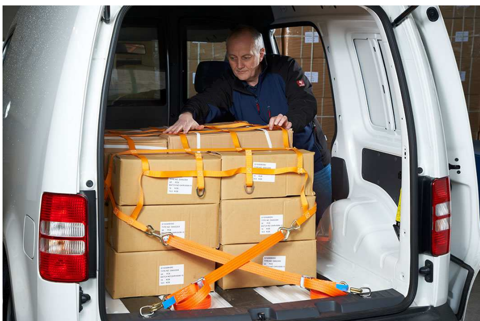
Abb. 4: Sicherung von Kartons mit PaXafe Gurtbandnetz.