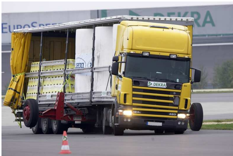
Abb. 4: Die Sicherung verschiedenster Ladegüter mit TruXafe wurde von der Dekra auf Basis von Fahrversuchen bestätigt.

E-Mail bhuerten@yahoo.de Internet: www.spanset.de