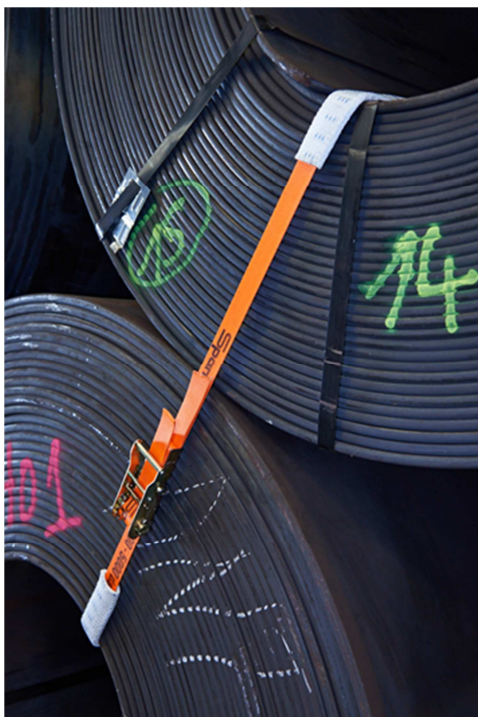
Abb. 2: Das Dynamic Load System besteht aus der Dynamic Load Ratsche und dem orangefarbenen EasyLashtex Gurtband.

SpanSet GmbH & Co. KG Jülicher Straße 49-51 52531 Übach-Palenberg