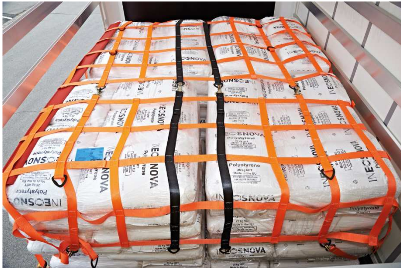
Abb. 3: Beim PaXafe Netzbaukasten lassen sich die Komponenten flexibel miteinander kombinieren.

SpanSet GmbH & Co. KG Jülicher Straße 49-51 52531 Übach-Palenberg