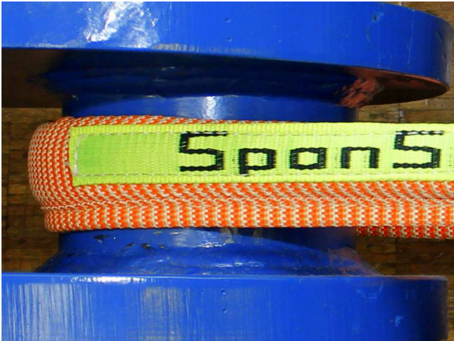
Abb. 4: Die besonders kompakte Bauform der Magnum-X short wird durch eine eng vernähte Schlauchhülle erreicht und erleichtert die Handhabung.