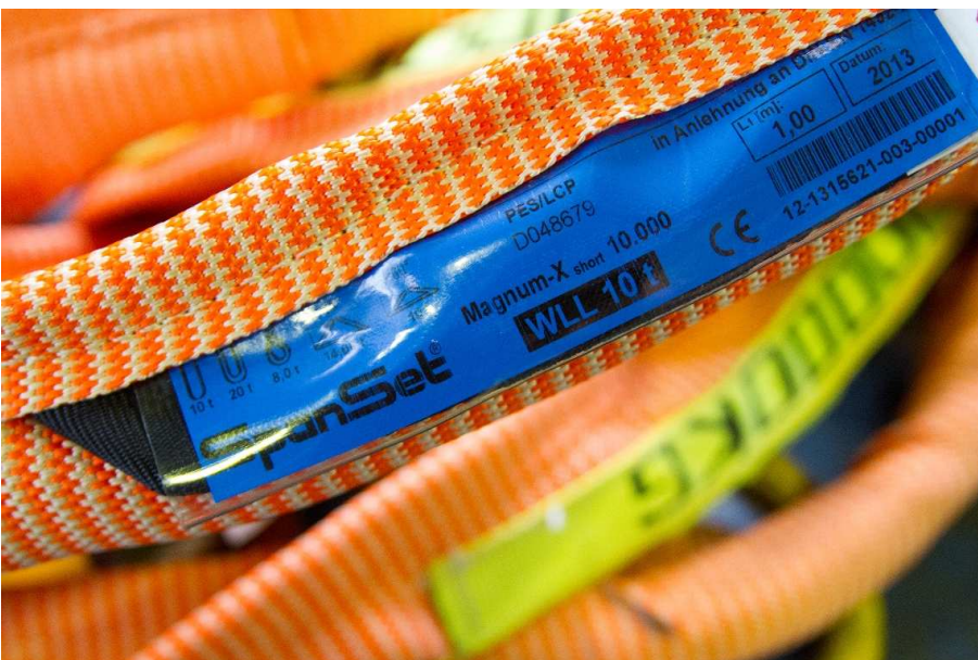
Abb. 3: Die spezielle, ausreiß- u. abriebfeste Konstruktion des Labels ist einzigartig, der serienmäßig integrierte RFID Transponder vereinfacht die Prüfdokumentation.