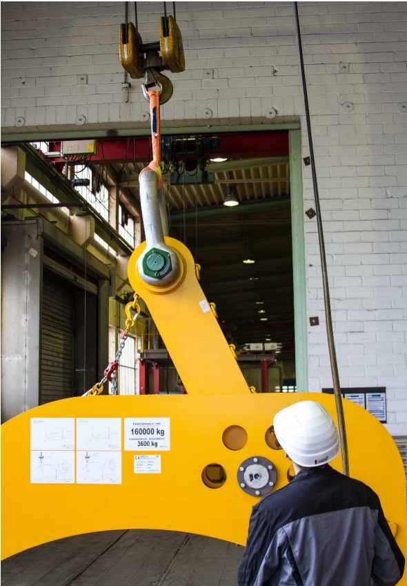
Abb. 2: Das innovative Fertigungsprinzip ermöglicht bisher unerreicht kurze Nutzlängen. Die ohnehin schon kurze Magnum-X kann im Schnürgang u. im U eingesetzt und damit nochmals verkürzt werden.