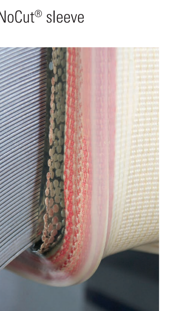
SF1 Schutzschlauch mit Armierung