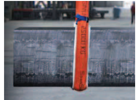
MagnumPlus mit Schnittschutz NoCut