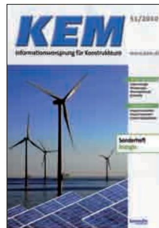
Press coverage: The engineering magazine KEM on the Magnum-X round sling with 400 t lifting capacity