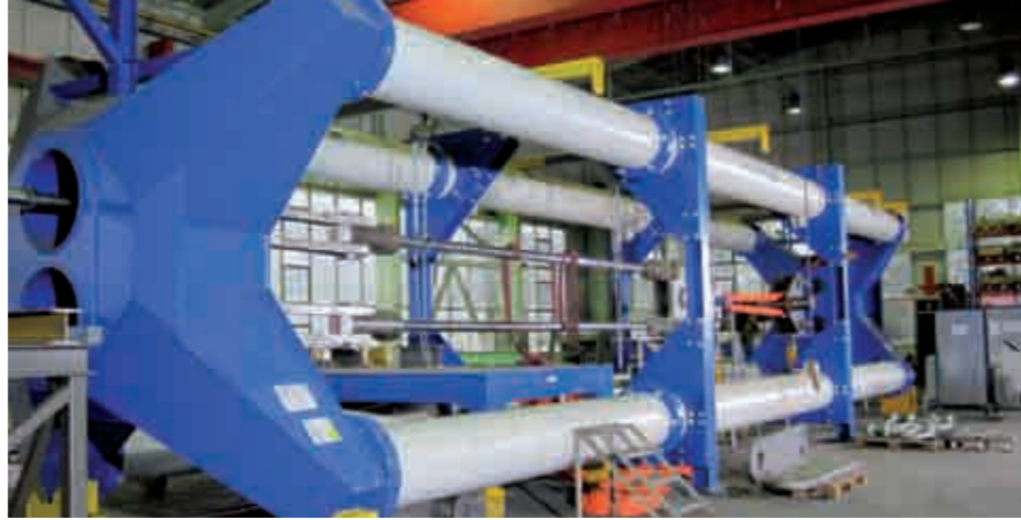
The 600 t test rig at Axzion