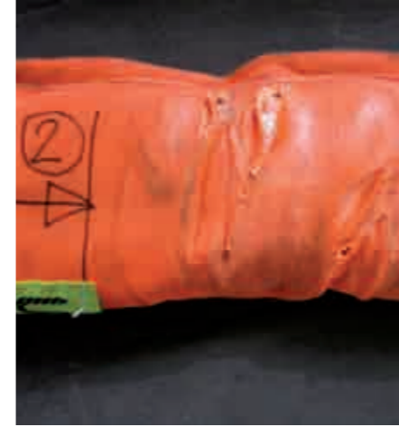
Typical impression marks after stressing with four times the nominal carrying capacity with a woven round sling sleeve