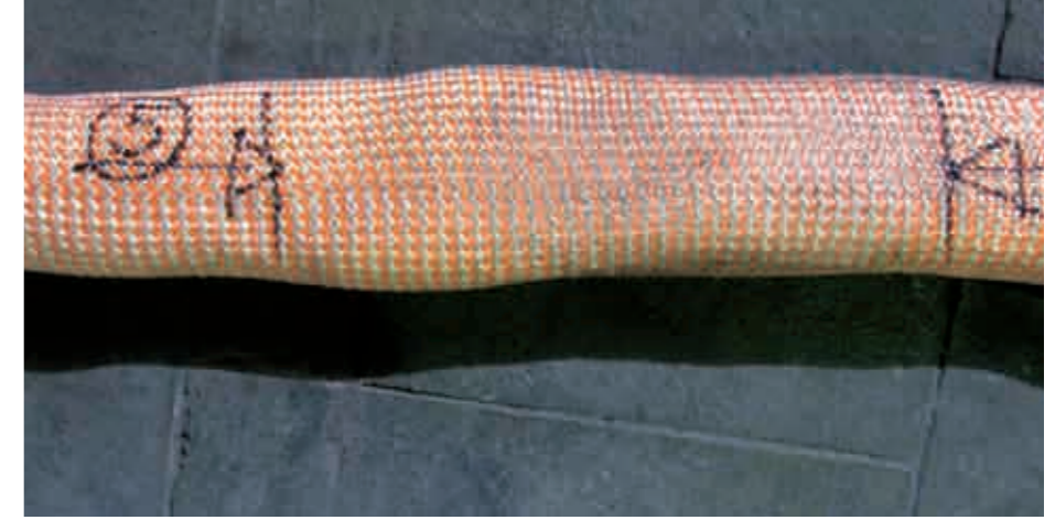
Much less damage to the protective sleeve of the Magnum-X round sling sleeve after stressing with four times the nominal carrying capacity thanks to an innovative sleeve construction